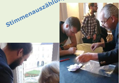
H7 und H8 - Farbe Blau