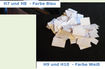
H9 und H10 - Farbe Weiß