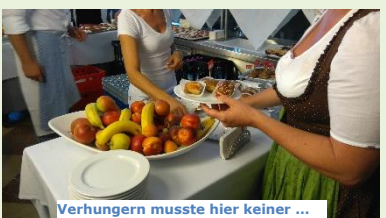
Verhungern musste hier keiner ...