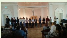
Vorstellung der Kandidaten

Auszeichnung zur Umweltschule Europa (bereits zum 9. Mal)