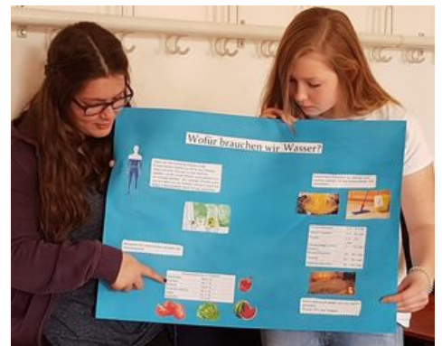
Präsentation der Ergebnisse nach der Recherche